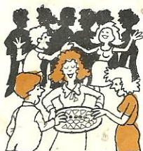
a la fiesta